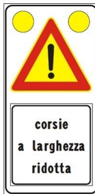
Figura Il 391c Art. 31